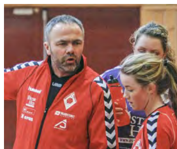
2011: Men rykket ned igjen til 3. divisjon.