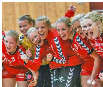
2012: Så rykket de opp igjen.