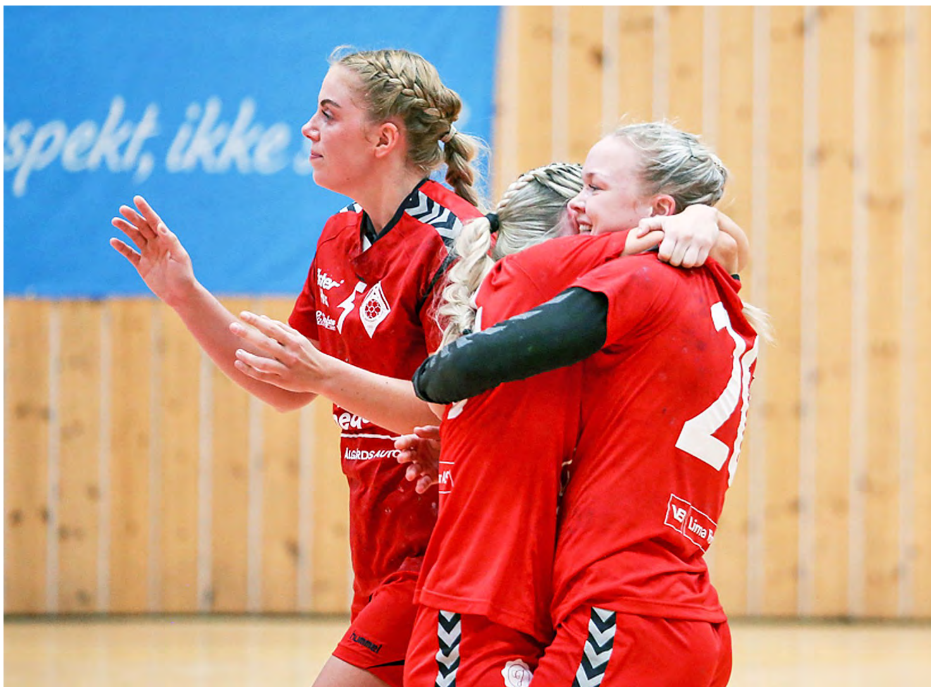
HÅNDBALL: Jubelen sto i taket da opprykket ble sikret i Gjesdahlhallen, men spill i 1. divisjon koster mye penger.