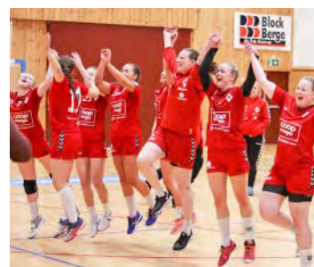
2018: Ålgård ble både seriemester og rykket opp til 1. divisjon.