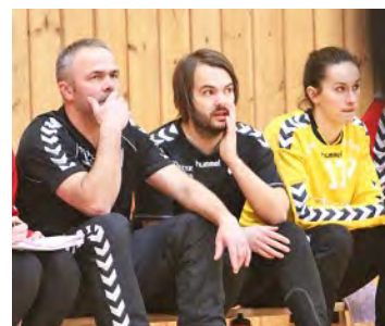
2014: Veien mot 1. divisjonsspill ble krevende, tøff og langvarig. Det var mye som måtte perfektioneres.