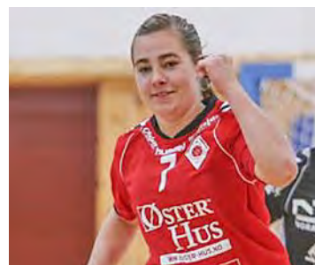
2013: De neste årene skulle blikket være vendt oppover for Ålgård-spillerne.