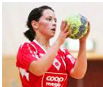
2010: ÅHK klamret seg fast i 2. divisjon.