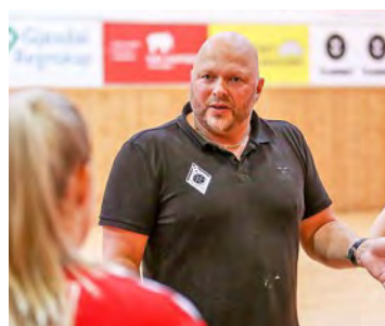
2017: Motstanden ble for sterk for Ålgård som endte på 5. plass i 2. divisjon sesongen 16/17.