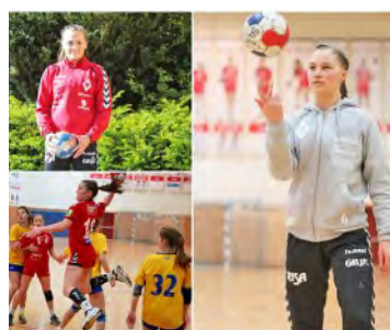
2017: Gautestad fornyet kontrakten, men flere av spillerne forsvant ut av klubben. Unge lokale talent skulle fylle de ledige plassene på laget.